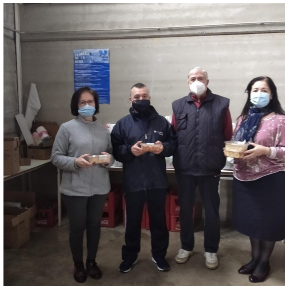
Economato Miguel de Mañara