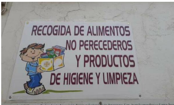
Cartel Marcha Solidaria