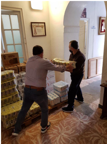
Entrega de alimentos de la Marcha Solidaria