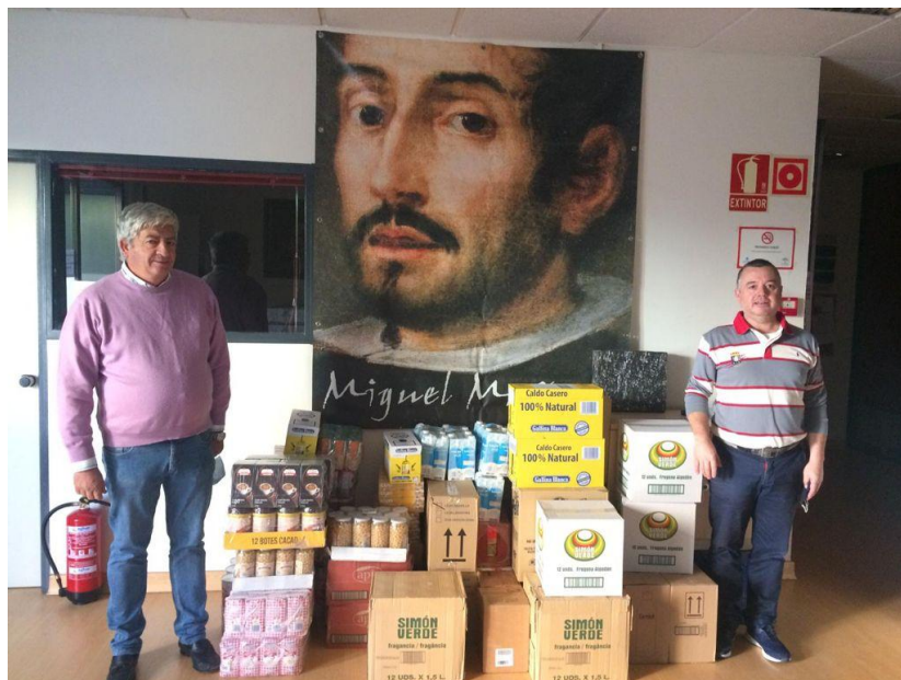
Economato Miguel de Mañara