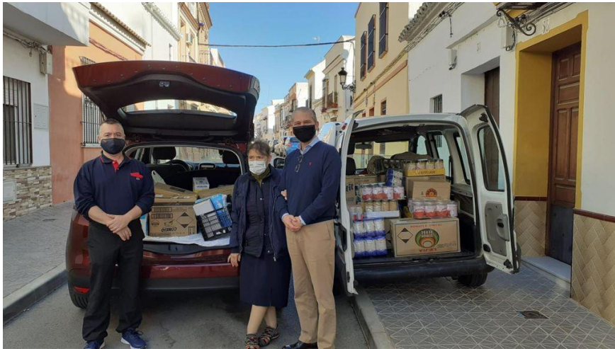
Hijas de la Caridad “San Cayetano”