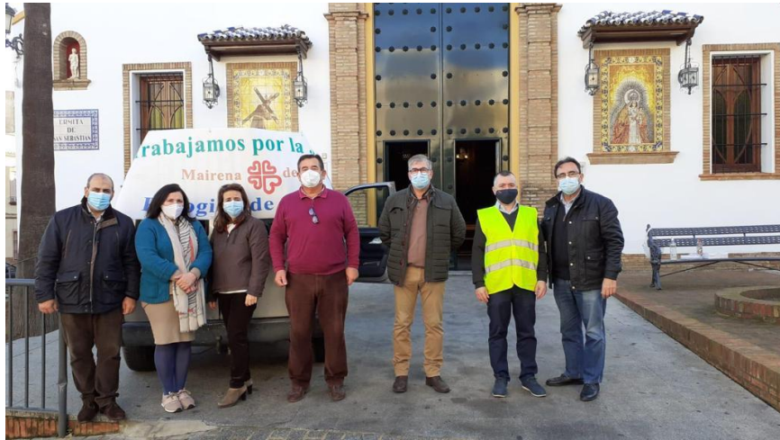
Campaña de recogida de alimentos de Cáritas