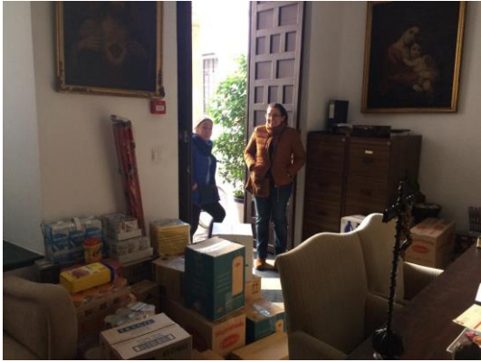
Hospital de la Caridad (Sevilla)