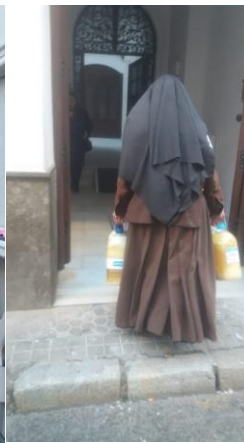
Hermanitas de los Pobres (Sevilla)