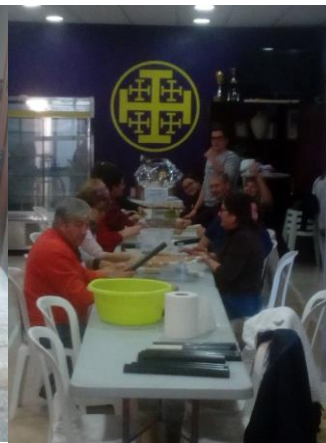
Elaboración de pestiños