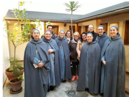
Hijas del Cordero (Granada)