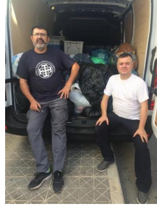
Llamada de Fuego