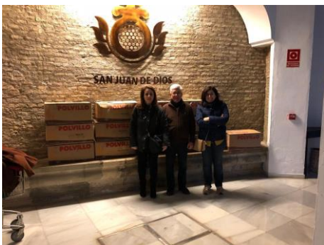
Comedor San Juan de Dios