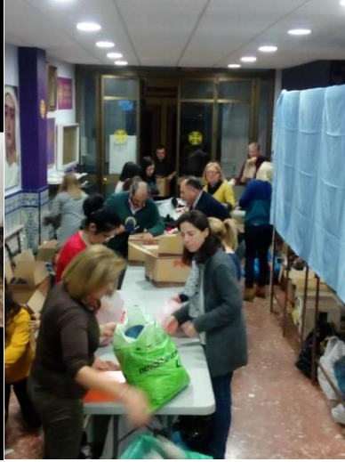
Clasificación de ropa